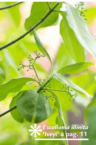
Escallonia illinita 'Iveyi' a pag. 11