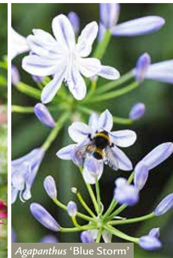
Agapanthus 'Blue Storm'