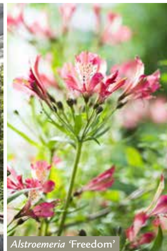
1 Alstroemeria 'Freedom'