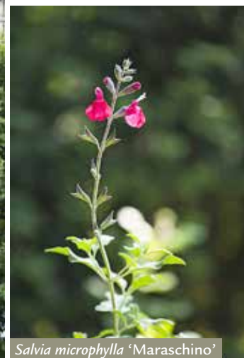
Salvia microphylla 'Maraschino'

In alto: la zona del terrazzo davanti alla camera da letto. Nella fioriera, Acer palmatum coreanum 'Dissectum Ornatum', Iris japonica e Vinca minor . A sinistra: falsi gelsomini e Callistemon rigidus ricadono oltre la balaustra.