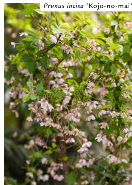
Prunus incisa 'Kojono-mai'

Le piante sono quindi state collocate in una lunga successione di fioriere disposte lungo i lati, accompagnate, ai quattro angoli, da grandi vasche cilindriche, disegnate e realizzate dall'azienda del proprietario, in →